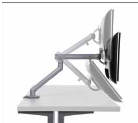
Controle dinâmico e intuitivo com 40 graus de inclinação para cima e para baixo

Flo recebeu vários prêmios, inclusive o 2010 National Ergonomics Conference and Exposition's "Attendees' Choice", e o 2010 "Red Dot", prêmio para produtos de design.