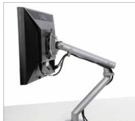
Seu sistema mantém os cabos fora da vista