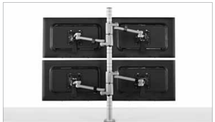
Capacidade de 1 a 4 monitores no mesmo suporte