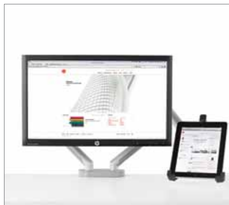
Opções de suporte para 1 a 4 monitores, 1 monitor e 1 laptop ou 1 laptop e 1 tablet